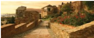
Das Römische Theater