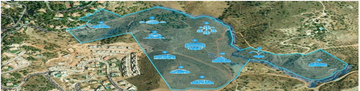
„Zentrums der Kommunikation zwischen den Zivilisationen“ und Konzepte für künftige Objekte, die auf Umsetzung warten:

Mit Zustimmung der Russischen orthodoxen Kirche und dem Segen des Seinen Heiligkeit der Patriarch von Moskau und ganz Russland Kyrill, sowie mit Unterstützung der Botschaft der Russischen Föderation in der Republik Spanien und mehrerer kommerzieller und gesellschaftlicher Strukturen der beiden Länder, wie auch auf Initiative und aktiver Beteiligung der der Interregionalen gesellschaftlichen „Verein der Freunde von Spanien“ und der CINCO ESTRELLAS PINARES DE SAN ANTON (Eigentümersin eines Grundstücks mit einer Fläche von 13,931 ha in einem der vornehmsten Viertel der Stadt Málaga (Stadtbezirk El Palo) auf einer Anhöhe von 150 Metern über dem Meeresspiegel und 800 Meter von der Küste entfernt, 5 Minuten mit dem Auto vom Stadtzentrum und 15 Minuten mit dem Auto vom Flughafen, anderthalb Stunden Fahrt zu einem der besten alpinen Erholungsorte der Welt, der Stadt Granada) wird ein moderner Architekturkomplex auf internationalem Niveau zur Realisierung angeboten.