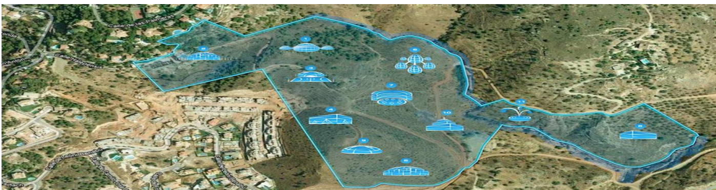
«Центр межцивилизационных коммуникаций» и концепции будущих объектов предлагаемых к реализации:

С согласия Русской Православной Церкви и благословения Святейшего Патриарха Кирилла, при поддержке посольства России в Испании, ряда коммерческих и общественных структур двух стран, а также по инициативе и активном участии МОО «Ассоциация друзей Испании», компании «CINCO ESTRELLAS PINARES DE SAN ANTON» (владеющей земельным участком площадью 13,931га, расположенном в одном из престижнейших районов г. Малага (район Эль Пало) на высоте 150 метров над уровнем моря и в 800 метрах от берега, в 5 минутах езды от центра города и в 15 минутах езды от международного аэропорта, в полутора часах езды от одного из лучших горно-лыжных курортов мира — города Гранады) предлагается к реализации современный архитектурный комплекс международного уровня.